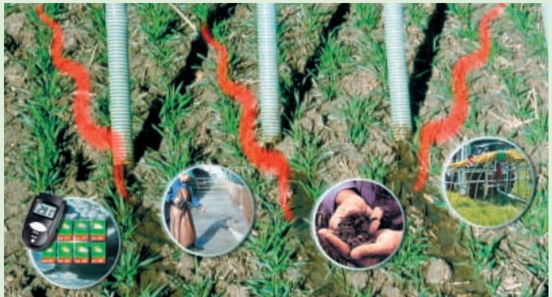
Ausbringzeitpunkt, Verdünnung der Gülle, Bodenzustand und Vegetation sowie die Ausbringtechnik beeinflussen die Ammoniakverluste bei der Hofdünger-Ausbringung.

In der Nacht ist die Luftfeuchtigkeit in der Regel höher und die Temperatur geringer als tagsüber. Deshalb geht bis zu 50 % weniger Ammoniak-Stickstoff verloren, wenn die Gülle abends ausgebracht wird.